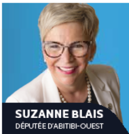
SUZANNE BLAIS DÉPUTÉE D'ABITIBI-OUEST

Nous osons espérer que des mains se lèveront; la survie du Journal Le Pont de Palmarolle en dépend.