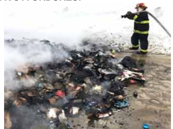
Le résultat d'un incendie dans le camion d'ordures...

Nous souhaitons vivement ne pas avoir à nous rendre jusque-là.