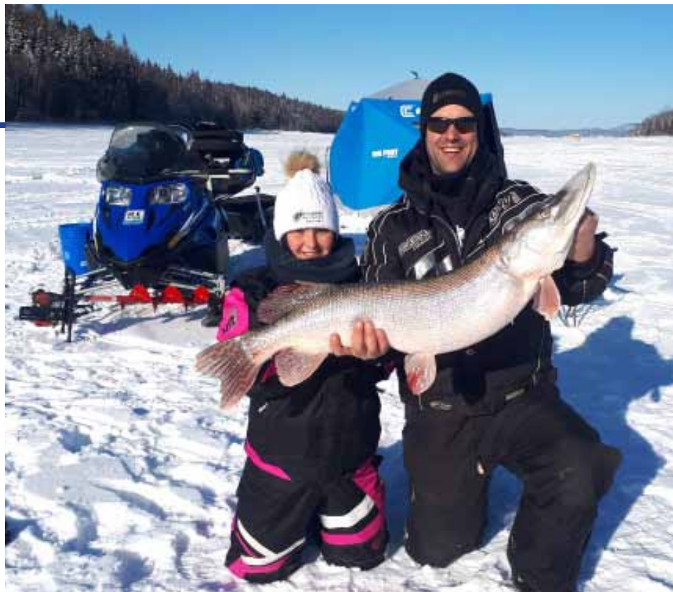
43 pouces, Beauchatel

On pêche pour diverses raisons, certains pour se ressourcer, d'autres pour passer du bon temps avec les amis et la famille. Mais une chose dont je suis certain, on rêve tous de prendre un poisson trophée. Que ce soit un doré ou un gros brochet. Nous sommes chanceux, le lac Abitibi qui nous est accessible nous donne la possibilité à chaque sortie de prendre un tel poisson.