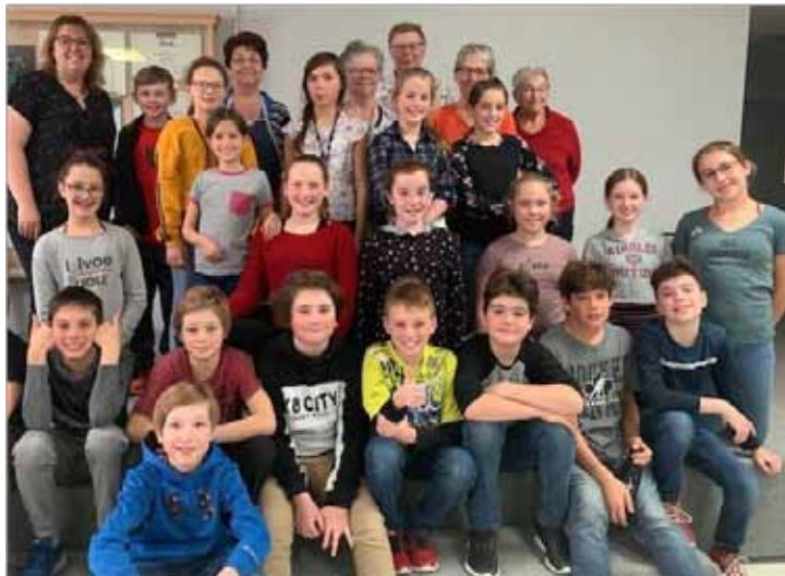
Un des deux groupes d'élèves de 5 e et 6 e année de l'école Dagenais, pavillon de Palmarolle